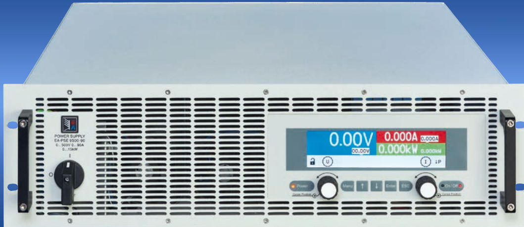
EA-PSE 9500-90 3U

Programmierbare DC-Hochleistungsnetzgeräte Programmable high efficiency DC Power supplies