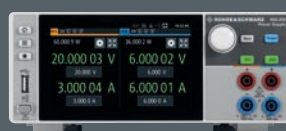
R&S®NGL200 Präzisions-Netzgerät und Senke 120 W Sie sparen bis zu € 360