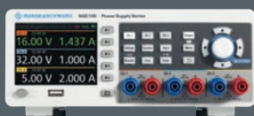
R&S®NGE100B Netzgerät 100 W Sie sparen bis zu € 385

Dieses einzigartige Angebot gilt ab sofort und läuft bis zum 31. Dezember 2019.