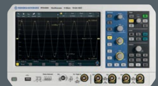
R&S®RTA4000 Oszilloskop 1 GHz Sie sparen bis zu € 9.980