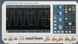
R&S®RTB2000 Oszilloskop 300 MHz Sie sparen bis zu € 2.365