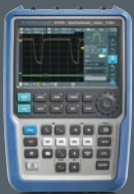
R&S®RTH Scope Rider Handheld-Oszilloskop 500 MHz Sie sparen bis zu € 4.390

Dieses einzigartige Angebot gilt ab sofort und läuft bis zum 31. Dezember 2019.