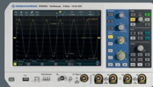
R&S®RTM3000 Oszilloskop 1 GHz Sie sparen bis zu € 8.205