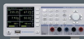
R&S®HMC8015 Einphasen- Leistungsanalysator Sie sparen bis zu € 950