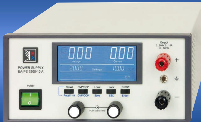
EA-PS 5200-10 A

Programmierbare DC-Tischnetzgeräte Programmable desktop DC Power supplies